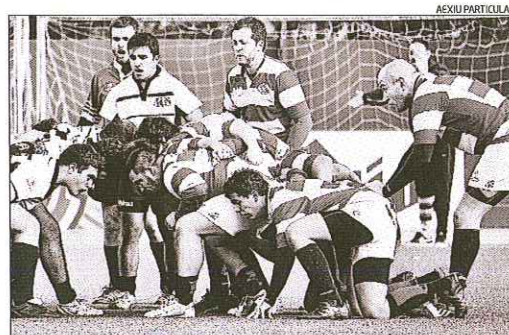
Els manresans van plantar cara a la primera part

Les noies van jugar el seu partit amistós en la modalitat reduïda a 7 i van aconseguir un assaig per tres de les visitants, i que sumats als cops de càstigs transformats deixaven el resultat final en 7-25. Pel que fa al conjunt masculí, va fer una actuació convincent enfront un adversari amb trajectòria de més de 20 anys en el rugbi. El Manresa RC, que és tercer a la classificació, es va enfrontar al líder amb un equip que estava força castigat per